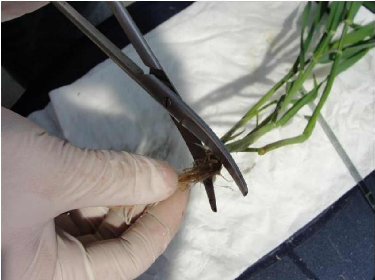
- zbieranie materiału II wariantu suszy